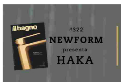
Cover Backstage #322 Il Bagno Oggi e Domani- NEWFORM...