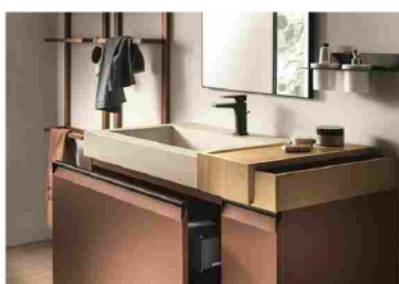
INDUSTRY meets FUTURE #326 | La sostenibilità...