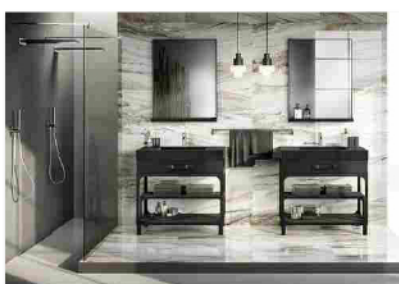
Diesel Misfits Bathroom by Scavolini: il connubio...