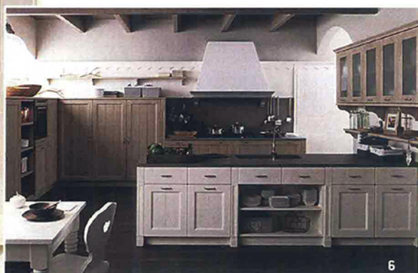
▲ LA PENISOLA ATTEZZATA SU DUE LATI È ACCOSTATA A UNA BOISERIE . SU CUI SONO FISSATI PENSILI CON ANTE IN VETRO E MENSOLE CON SOSTEGNI SAGOMATI

Le scanalature oblique all'interno del cassetto consentono di accogliere un maggior numero di utensili, anche quelli più lunghi.