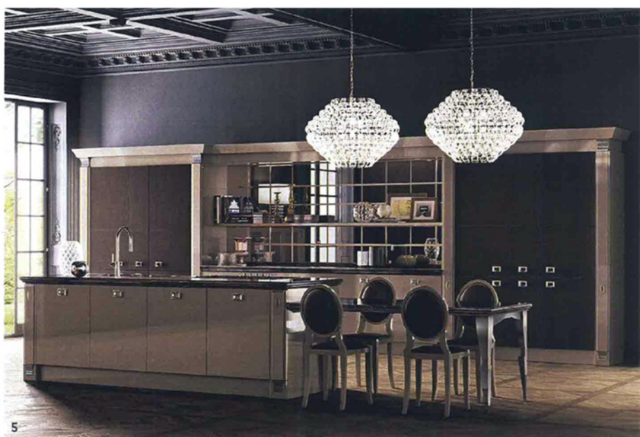
▲ CLASSICO IN VERSIONE LUXURY. IN CUI SPICCANO LA GRANDE ISOLA CON TOP IN MARMO EMPERADOR AD ALTO SPESSORE E GLI ARMADI CON ANTE IN PELLE EBANO E CUCITURE SUI BORDI (COORDINATI ALLE SEDIE). IMPREZIOSITI DA CAPITELLI CROMATI . IN PERFETTA ARMONIA, IL SOFFITTO A CASSETTONI IN GESSO DECORATO, IL PARQUET INTARSIATO E I LAMPADARI IN CRISTALLO.

PROVENZALE, COUNTRY, SHABBY, CLASSICO-CHIC: LO STILE TRADIZIONALE SI DECLINA IN VARI MODI. IN COMUNE HANNO LA CURA DEI DETTAGLI , DAI PIÙ SEMPLICI, COME MANIGLIE A VISTA, MODANATURE, CORNICI SAGOMATE E VETRINE, AI PIÙ RICERCATI, COME FREGI E CAPITELLI